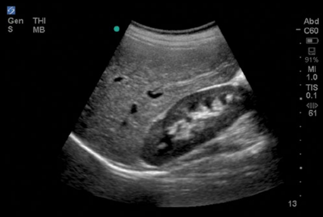
Fígado, rim direito