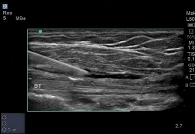
Injeção de ombro com SonoMBe