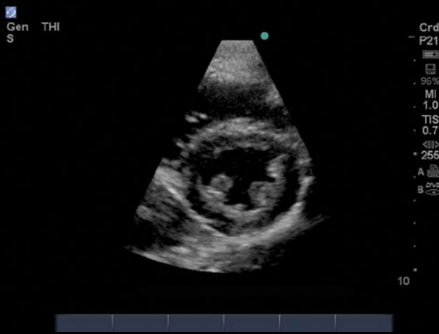
Paraesternal eixo curto coração