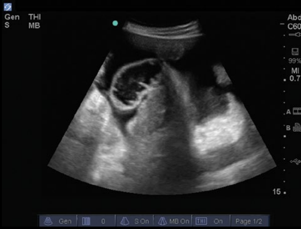
Abdome – Pelve – Líquido Livre